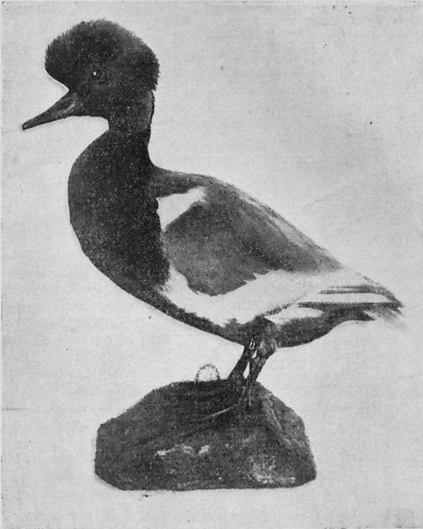
Мал. 2. Чернь червонодзьоба ( Netta rufina Pall). Екземпляр, що його здобуто на провесні 1926 року, коло Переяслава.

понував мені купити живого самця качки, що нас цікавить, в шлюбному вбранні. Птаха, як він мені казав, він піймав на Дніпрі коло Київа 5 березня 1927 р. на льоду. Птиця була худа та остільки стомлена, що не могла підлетіти. Було-б цікаво одержати додаткові відомості за червонодзьобу чернь в останні роки на Україні.