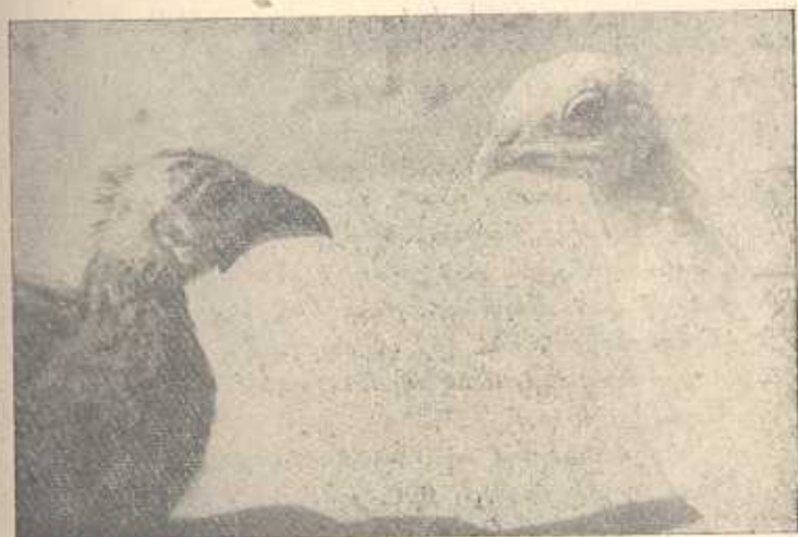
Рис. 2. Слева—голова цесарки, справа—голова гибрида ♂. Возраст птиц 90 дней.

Материалы, представленные в настоящем сообщении, позволяют сделать некоторое обобщение по отдаленной гибридизации в пределах отряда курных.